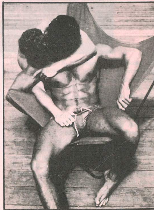
Gais en "Piscinas Sevilla" al conocer la noticia.

Mientras tanto siguen ocurriendo hechos inquietantes: como el juicio a dos paracaidistas acusados de cometer "actos deshonestos" (léase prácticas homosexuales), o ese proyecto de reforma de Código Militar que es especialmente severo en este tema. Noticias como éstas no relativizan lo conseguido y nos ponen de manifiesto, a la vez, lo necesario de una labor organizada que sistemáticamente repudie y conteste este tipo de arbitrariedades.